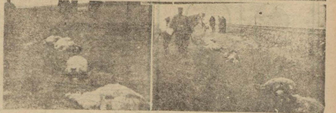
Faciadan sonraki hazine manzara

Üç gün evvel Eskişehir civarında tren yolunda bir facia oldu, Yusuf isiminde bir çoban tren çarpması neticesinde paramparça bir halde can verdi. Yine bu yüzden bir koyun sürüsünden beş onu da ölüp gittiler. Muhabirimizin gönderdiği bu resimler, tafsilâ mı evvele yazdığımız bu faciayı tesbit ediyor.