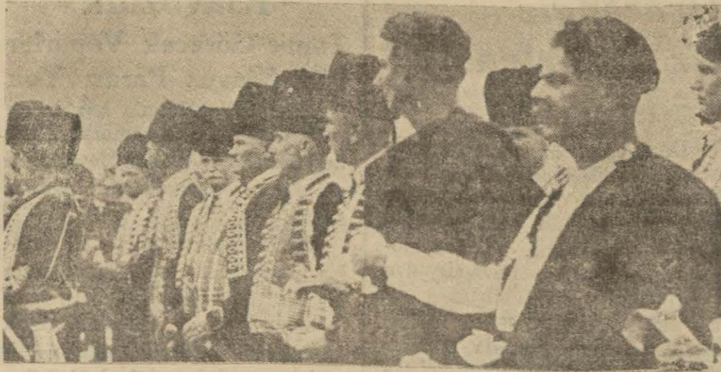
Yugoslav köglüleri, millî kıyafetleriyle yeni kırallarına bilate gelmişlerdir namda bir adam gelmiştir. Bu zat elyevm Fransadadır. Romanya Devlet Demiryolları memurların- (Devamı 11 inci yüzde)

Sarıışın Kadının Peşinde Fransız emniyeti umumiyesi