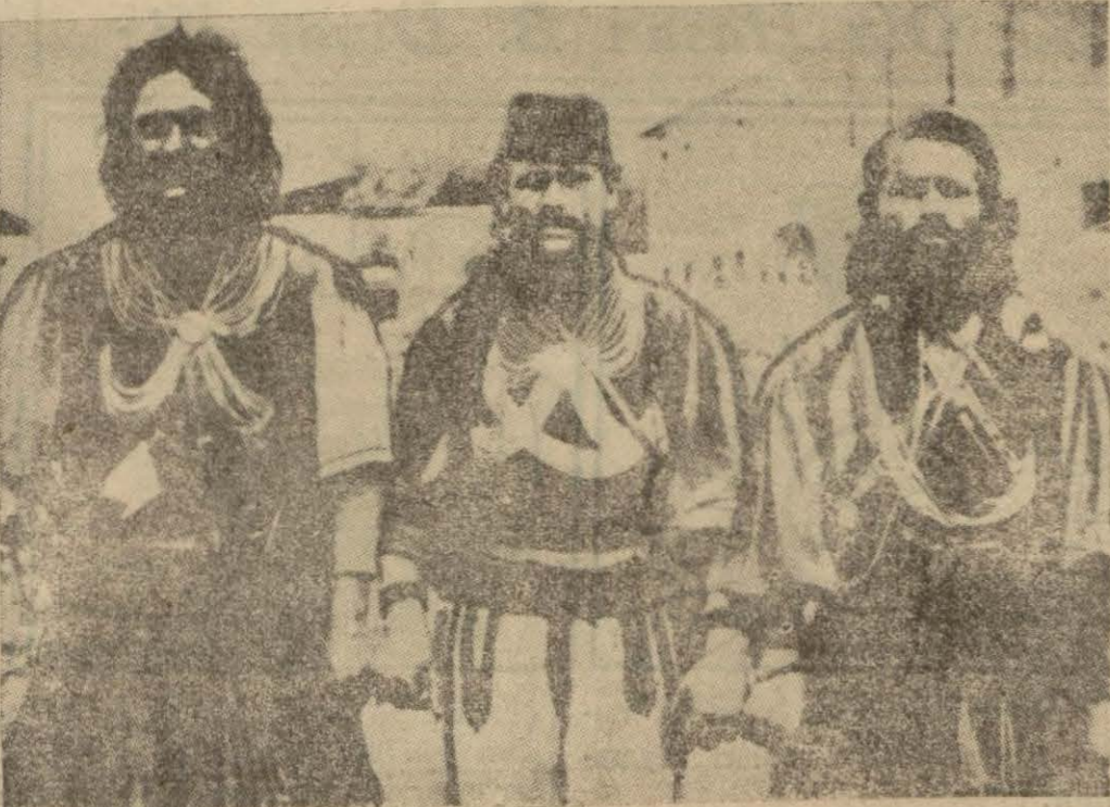
Üç tane Makedonya komiteci tipi