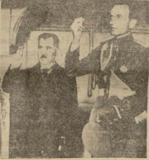
Prens Pol ve naip doktor Peroviç gemin ediyorlar